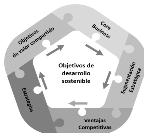
Figura 1. Pentágono estructurado de análisis estratégico

Para abordar la forma en que este emprendimiento social-solidario actúa en el mercado ecuatoriano se ha desarrollado un modelo denominado el “pentágono estructurado de análisis estratégico”. Este se desarrolla tomando la dirección que siguen las manecillas del reloj, partiendo el análisis, del core business de la empresa. Nótese que es una secuencia virtuosa que evidencia su constante revisión, sobre todo porque su centro estratégico considera la manera en que el negocio apunta a los Objetivos de Desarrollo Sostenible (ODS) que promueve el Programa de las Naciones Unidas para el Desarrollo (PNUD).