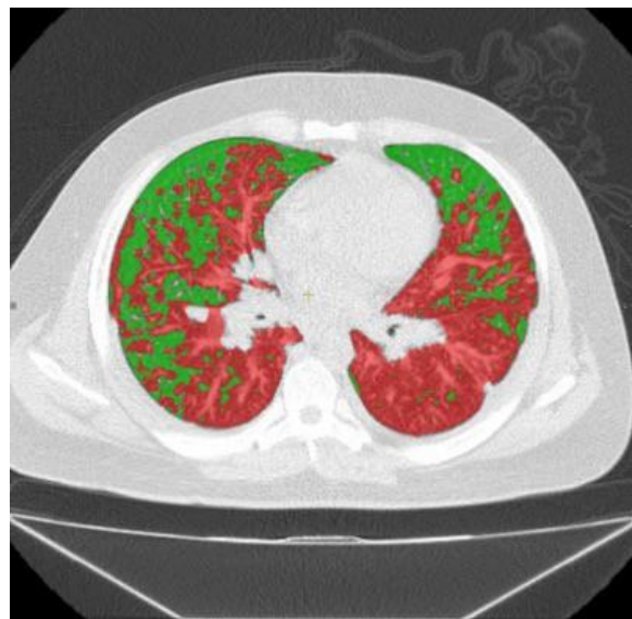
Figura 2. Tomografía computarizada