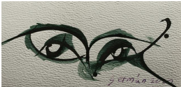
Figura 1. Rostros

Hace unos cinco años cuando los dedos no me obedecían al escribir sobre el pequeño teclado del celular, cuando se me empezó a dificultar el lavado de los dientes o, finalmente, cuando me diagnosticaron Párkinson, fue cuando volví nuevamente a colorear con tinta pedacitos de papel del tamaño de un billete, reapareciendo el gusto, al punto que todas las semanas pinto uno o dos días. Así, durante tres años, he elaborado unas 2000 láminas, y unas 200 de formato hasta cuarto de pliego.