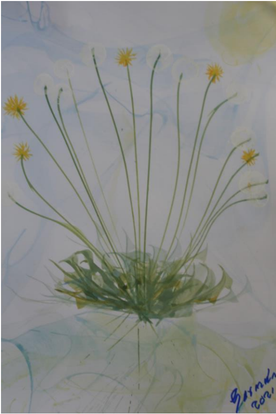
Figura 5. Diente de león