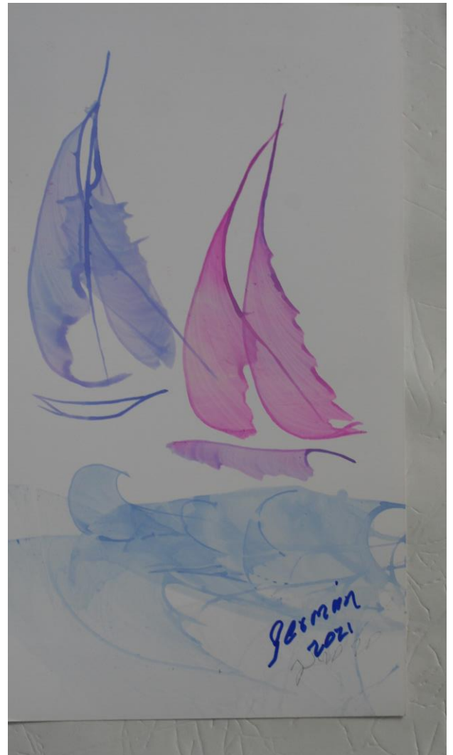
Figura 4. Velas

Mi cuerpo se relaja, mientras construyo un pincel o busco el equilibrio, la limpieza, el brillo y el trazo expresivo, o cuando empiezo a viajar por sitios y momentos recordados o imaginados. Allí todo se combina para que halle un estado agradable.