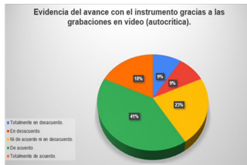
Pregunta 10 del cuestionario 1