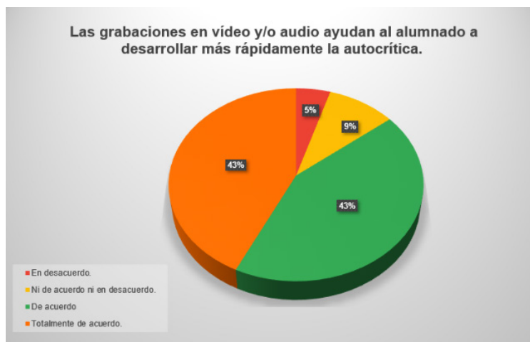
Figura 3. Pregunta 8 del cuestionario 2