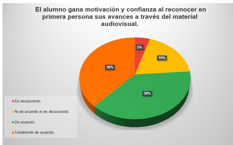
Figura 4. Pregunta 9 del cuestionario 2