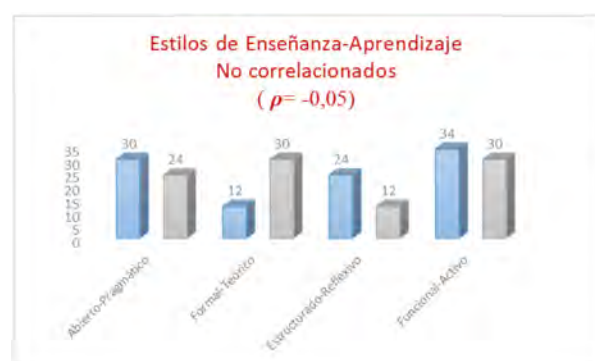
Figura N°2. Estilos de Enseñanza – Aprendizaje NO correlacionados