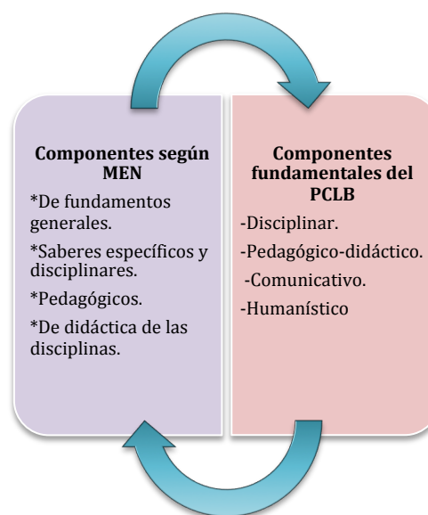
Figura 1. Semejanza entre los componentes según la Resolución 185835 de 2017 del MEN y los componentes fundamentales del Proyecto curricular de la Licenciatura en Biología, PCLB de la Universidad Pedagógica Nacional.