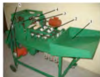
Figura 7. Deshojadora de mazorca para tamal (primer y segundo prototipos).

Un trabajo interesante fue desarrollar un robot trepador de palmeras (Figura 8) para la detección de cocos (Ramírez, 2012). El propósito de este trabajo fue diseñar, construir y probar un sistema robótico capaz de trepar palmeras para detectar cocos mediante un sistema de visión artificial. Para la construcción del robot se diseñó una estructura que pudiera adaptarse fácilmente a la forma física del tallo de la palmera (inclinación, altura y grosor). Esta estructura consta de un mecanismo de biela - manivela el cual permite al robot ascender por la palmera soportando su propia masa que es aproximadamente 7 kg incluyendo la estructura, motores, baterías y cámara.