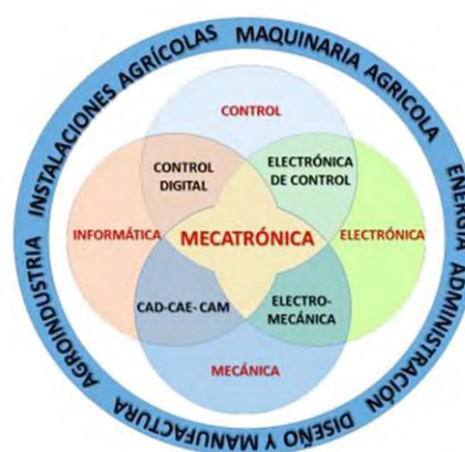
Figura 1. Esquema del Modelo para Ingeniería Mecatrónica Agrícola de la UACH.

La diferencia distintiva del presente proyecto es que la mecatrónica será aplicada en la agricultura, específicamente en las áreas del diseño y manufactura de la maquinaria e instalaciones agrícolas, la agroindustria, la energía y administración (gestión agrícola), como se muestra en el modelo.