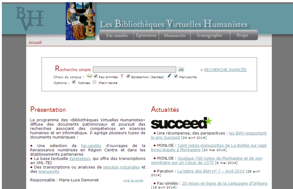
Figura 3: Bibliothèques Virtuelles Humanistes - página de acolhimento